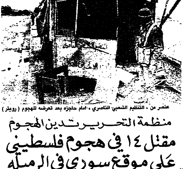
عصر من التنظيم الشعبي للتصاريح، امام حليزة بعد تعرضه للهجوم